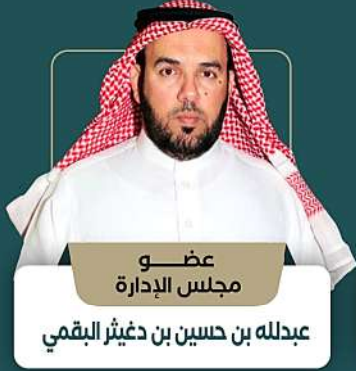
عضو مجلس الإدارة