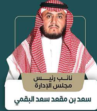
نائب رئيس مجلس الإدارة