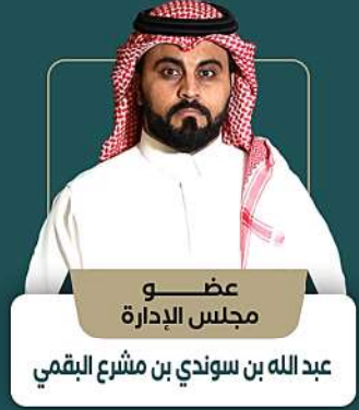
عضو مجلس الإدارة