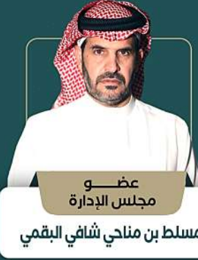
عضو مجلس الإدارة