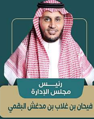
رئيس مجلس الإدارة